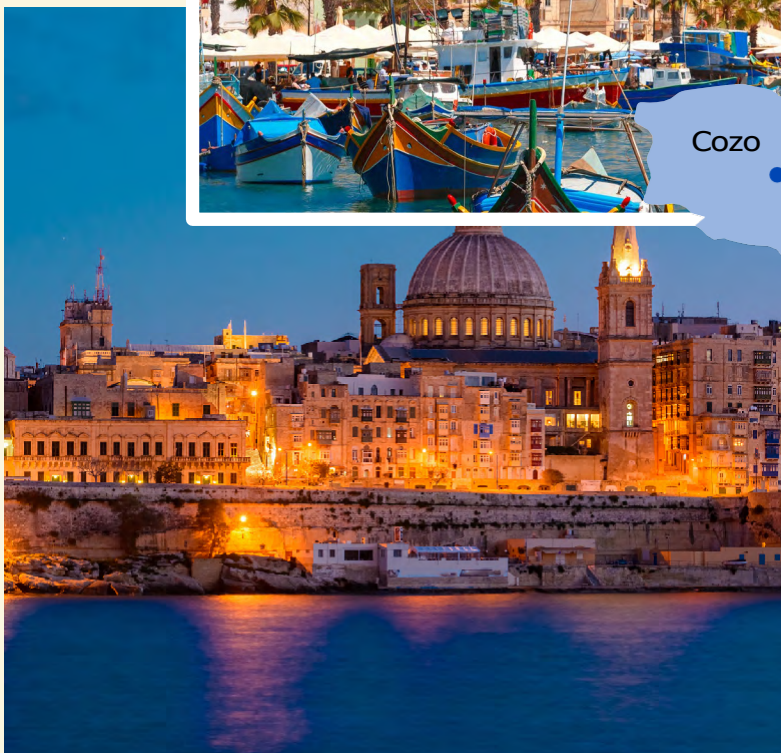
St Paul's Bay